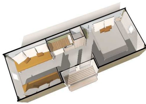
Coco Sweet 2017