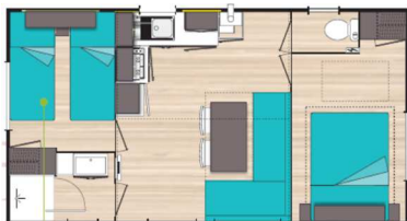
M H OPHEA 26m 2 - 2009 y 2012 5 personas - 2 habitaciones - 1 cuarto de baño 1 retrete – 1 pavimento de 9m 2