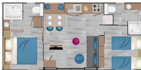
M H TAOS F4 35m 2 - 2021 4 personas - 2 habitaciones - 2 cuartos de baño 2 retretes – 1 terraza de 19 m 2