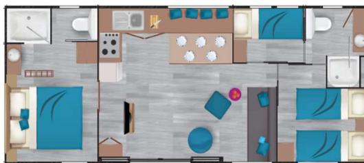
M H TAOS F6 40m 2 - 2018, 2020 y 2021 6 personas – 3 habitaciones - 2 cuartos de baño 2 retretes – 1 terraza de 22,5 m 2