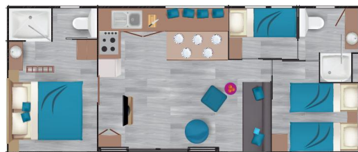
Mobil Home 26m2 ( 2009 et 2021)